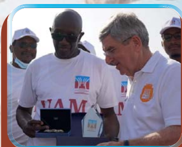
VISITE DU PRÉSIDENT DU CIO AU CAMPUS SOCIAL DE L'UAM

Plus qu'une formation, un avenir à construire